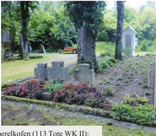
Oberelkofen (113 Tote WK II): Bewässerungsanlage installiert