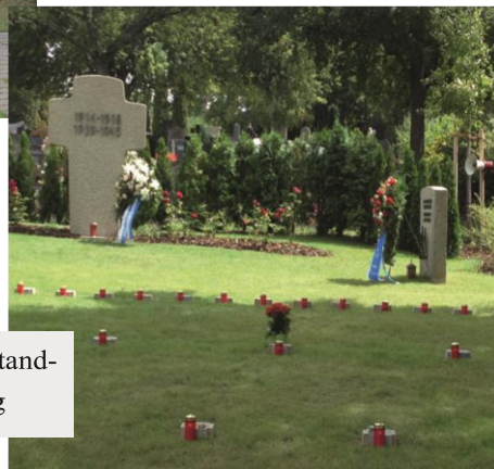
Creußen (35 Tote WK I + II): Instand- setzung und Zusammenbettung