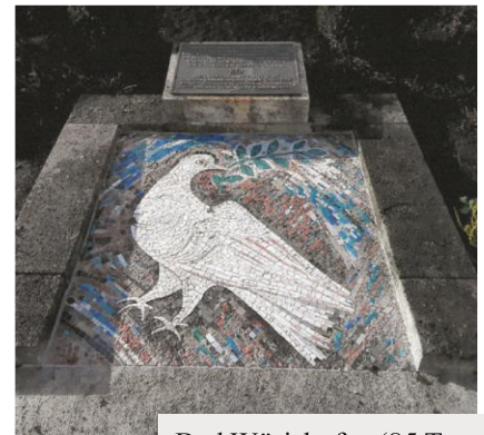
Bad Wörishofen (85 Tote WK I + II): Bodenmosaik fachmännisch restauriert