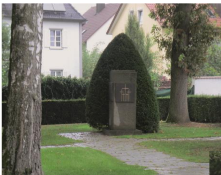
Straubing (788 Tote WK II): Neugestaltung des nord- westlichen Gräberfeldes