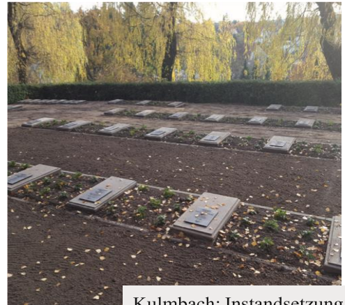
Kulmbach: Instandsetzung der Abt. WK II (127 Tote)