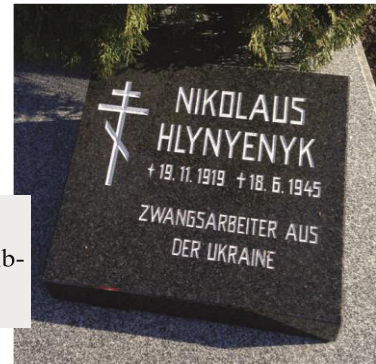
Markt Bibart: Neugestaltung Einzelgrab einschl. Namensschreib- weise und Gedenkaussage