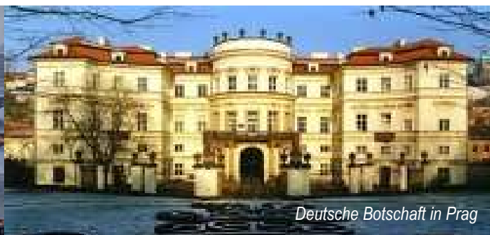
Deutsche Botschaft in Prag