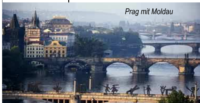
Prag mit Moldau